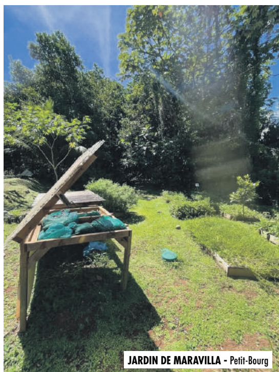
JARDIN DE MARAVILLA - Petit-Bourg