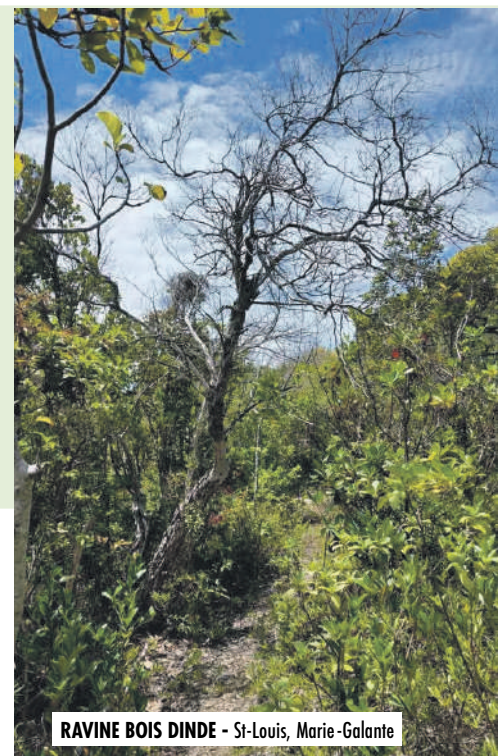
RAVINE BOIS DINDE - St-Louis, Marie-Galante