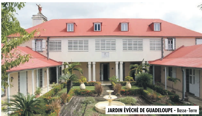
JARDIN ÉVÊCHÉ DE GUADELOUPE - Basse-Terre