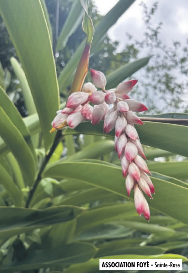
ASSOCIATION FOYÉ - Sainte-Rose