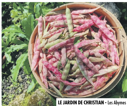
LE JARDIN DE CHRISTIAN - Les Abymes