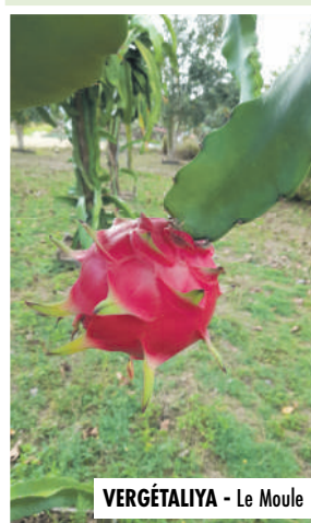
VERGÉTALIYA - Le Moule