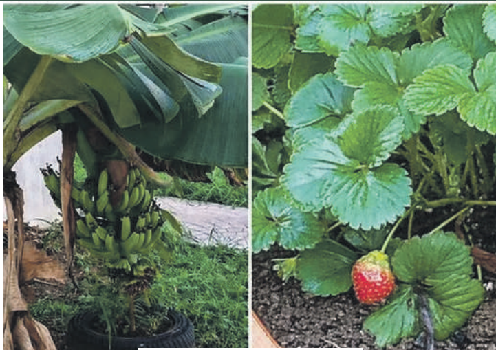
LE JARDIN DE MORTENOL - Pointe-à-Pitre

SAMEDI : 09 H à 16 H | DIMANCHE : 09 H à 13 H