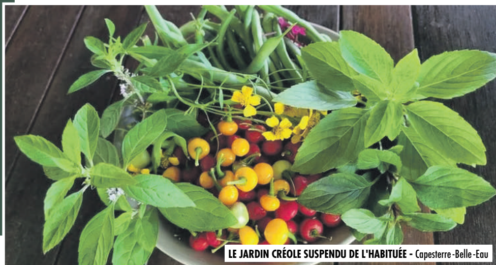
LE JARDIN CRÉOLE SUSPENDU DE L'HABITUÉE - Capesterre-Belle-Eau