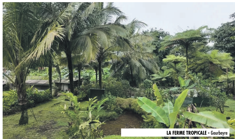
LA FERME TROPICALE - Gourbeyre