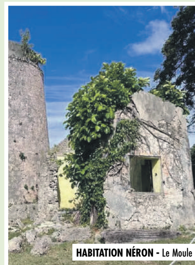
HABITATION NÉRON - Le Moule