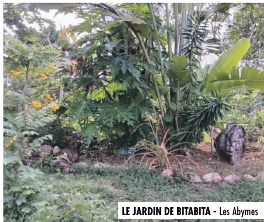
LE JARDIN DE BITABITA - Les Abymes