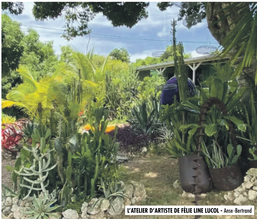
L'ATELIER D'ARTISTE DE FÉLIE LINE LUCOL - Anse-Bertrand