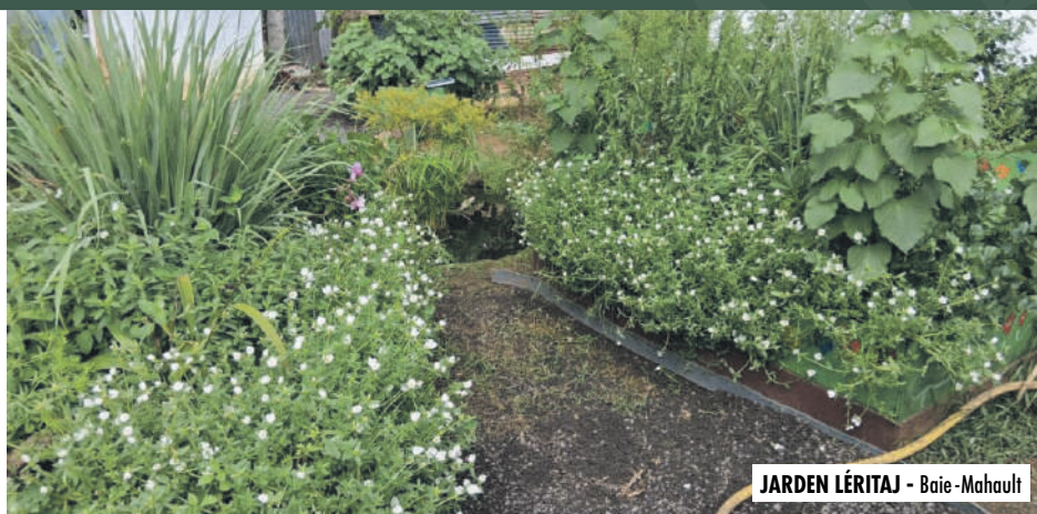
JARDEN LÉRITAJ - Baie-Mahault