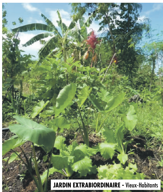
JARDIN EXTRABORDINAIRE - Vieux-Habitants