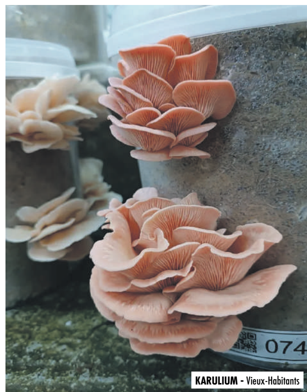
KARULIUM - Vieux-Habitants