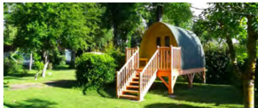
Camping Les coullemières de Vermenton