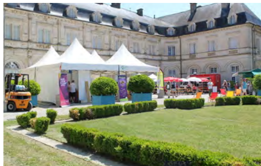
Jardins des musées à Champlitte