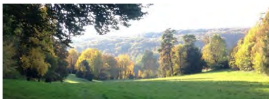
Parc du château de Taxenne

Dimanche 2 juin 2024 : 14h - 15h30 | 16h - 17h30