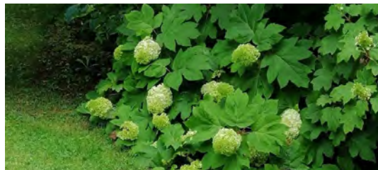
Jardin Annabelle | © Marie-claude David - Jardin de la collection Annabelle