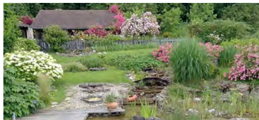
Jardin « En bouillot » | © Denis Monneret

Dimanche 2 juin 2024 : 09h30 - 12h | 14h30 - 18h