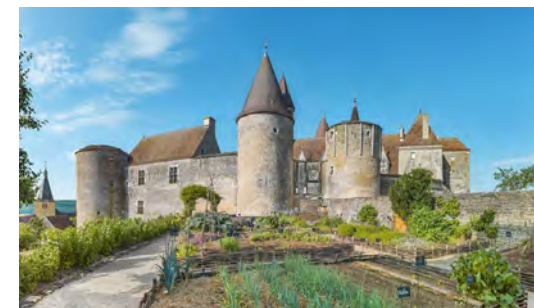
Château de Châteauneuf