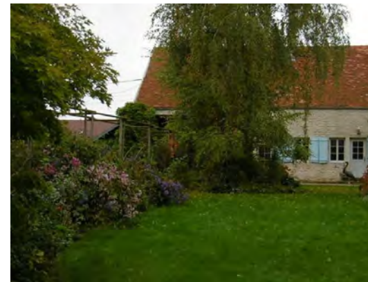
Jardin de la Clochette