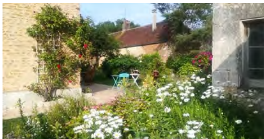
Jardin de la forêt

Dimanche 2 juin 2024 : 10h - 12h | 14h - 19h