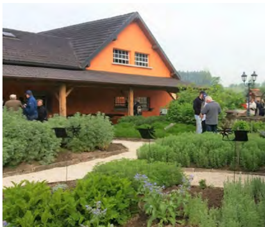
Jardin de la Fée Verte