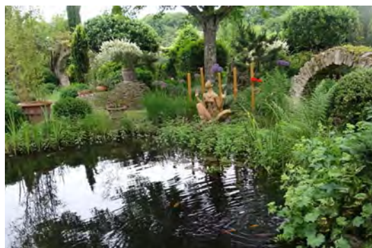
Jardin de Palladia