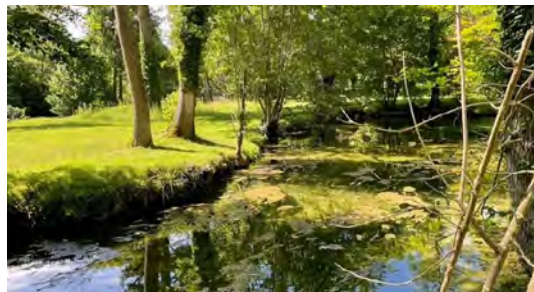
Parc des îles à Vermenton