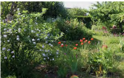
« Jardin imparfait »