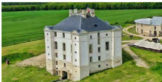
Château de Maulnes et ses jardins | © château de Maulnes