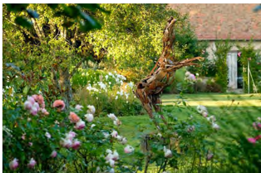
Jardin des Soussilanges

Vendredi 31 mai 2024 : 10h - 12h30 | 14h30 - 18h30 Samedi 1 er juin 2024 : 10h - 12h30 | 14h30 - 18h30 Dimanche 2 juin 2024 : 10h - 12h30 | 14h30 - 18h30