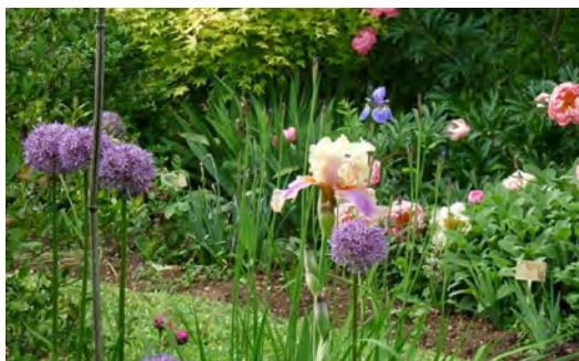
Jardin de Valentine