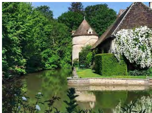
Jardin du parc Vieil

Dimanche 2 juin : 10h - 11h | 11h - 12h | 15h - 16h | 16h - 17h