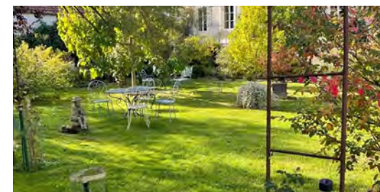
Jardin souriant

Dimanche 2 juin 2024 : 10h - 13h | 15h - 19h