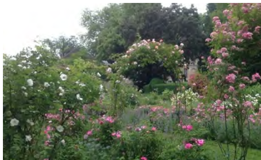
Jardin de roses anciennes de l'abbaye de Bèze

Dimanche 2 juin 2024 : 10h - 12h | 14h - 18h