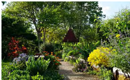
« Jardin bienveillant »

Dimanche 2 juin 2024 : 10h - 12h | 14h - 19h