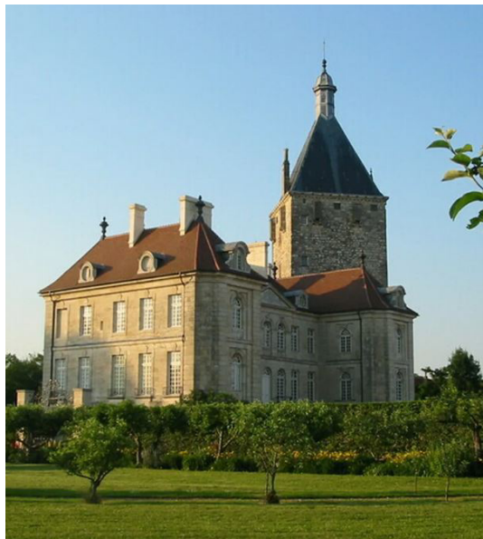
Château de Talmay