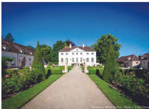
Domaine de Long-Depaquit