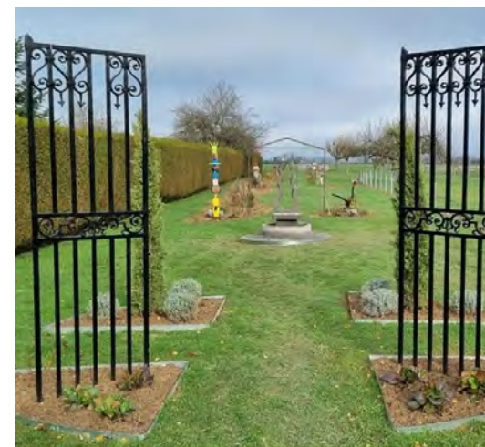
Jardin de la Dezerte