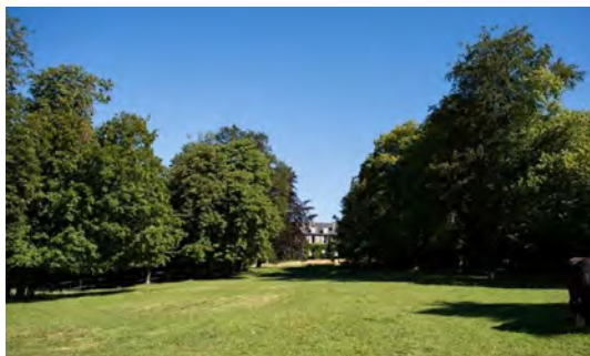
Parc du château de Chazoux | © Pilarschacher