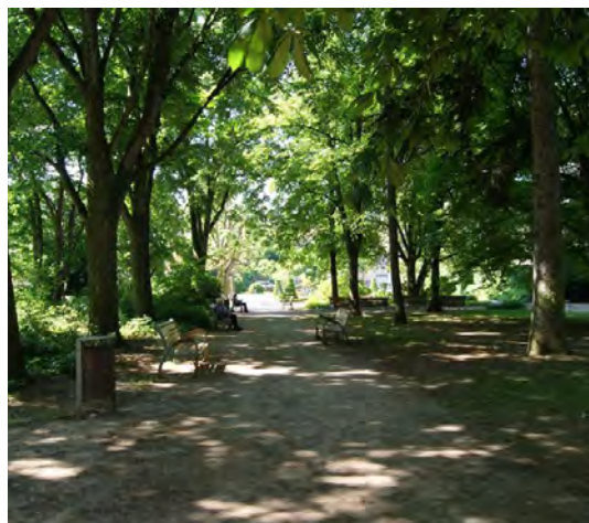
Square Émile Lechten