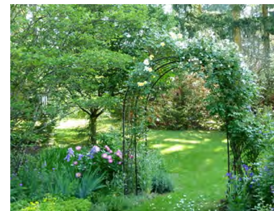
Jardin des Pins noirs | © Catherine Masure - les Pins noirs