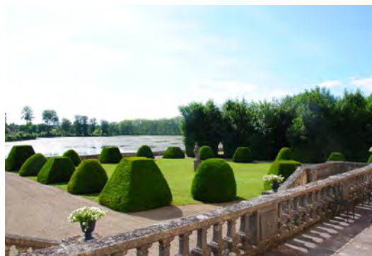
Jardin du château de Fontaine-Française