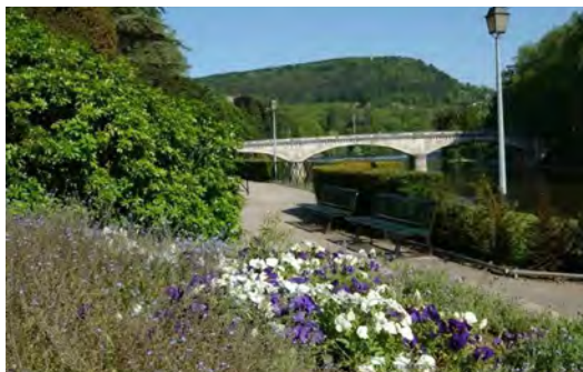
Jardin des sens