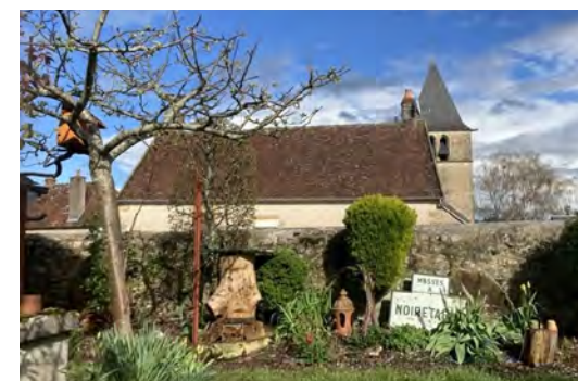
Un petit jardin particulier