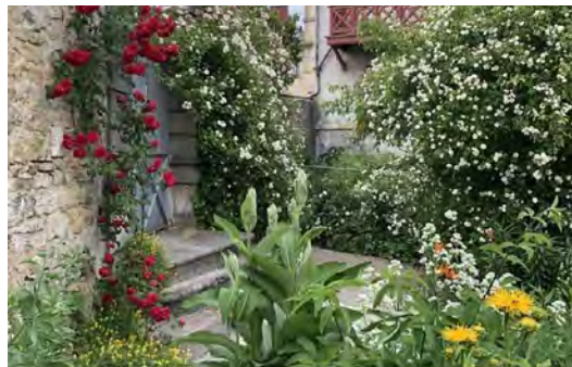
Parc botanique Jeanine Dessay

Dimanche 2 juin 2024 : 10h30 - 12h | 14h - 17h