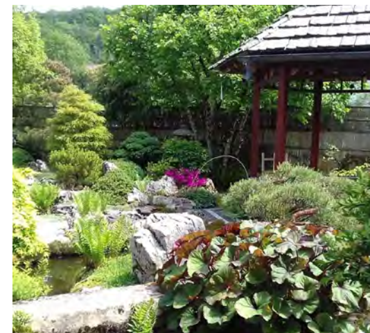
Jardin de « L'atelier jardin »

Dimanche 2 juin 2024 : 10h - 12h | 15h - 19h