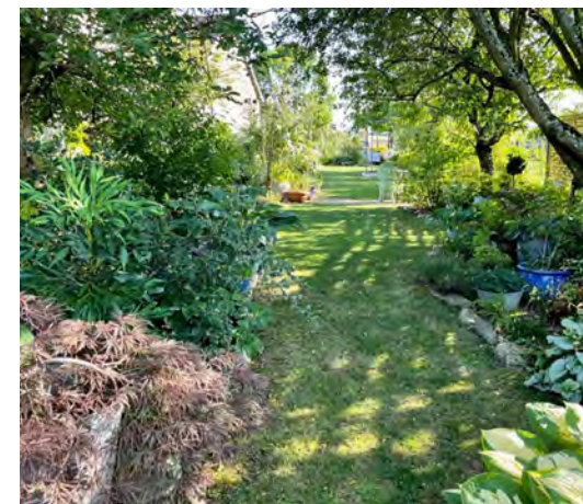
Jardin de la Piroudotte | © Alexis Knaus