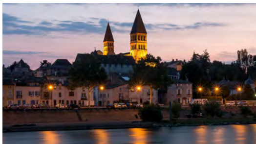
Abbaye de Tournus