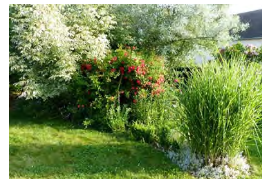
Jardin d'émotions

Samedi 1 er juin 2024 : 10h - 18h Dimanche 2 juin 2024 : 10h - 18h