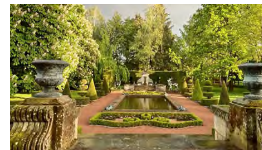
Jardin du château d'Ouge