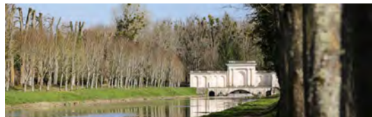
Parc et jardins du château de Tanlay

Dimanche 2 juin 2024 : 10h - 12h30 | 14h - 18h