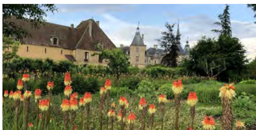
Jardin potager du château de Sully