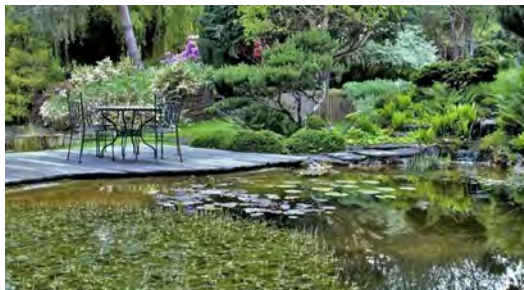
Jardin aquatique Acorus

Dimanche 2 juin 2024 : 09h - 13h | 14h - 19h