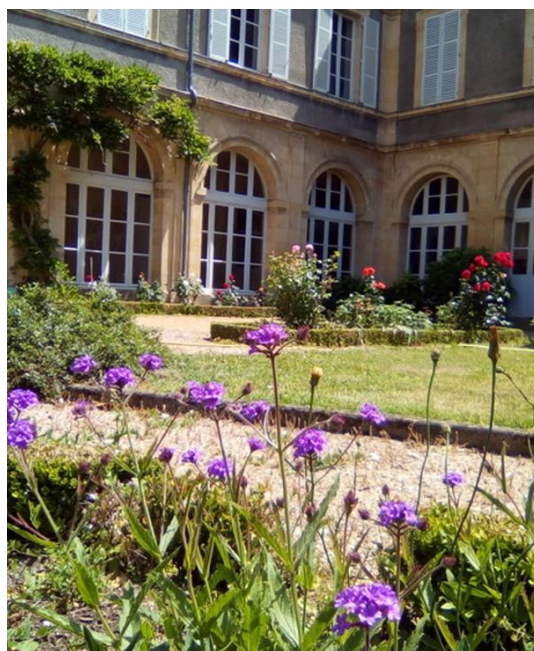
Jardin de sainte-Bernadette