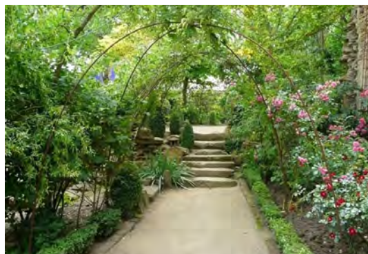
Jardin Adrienne