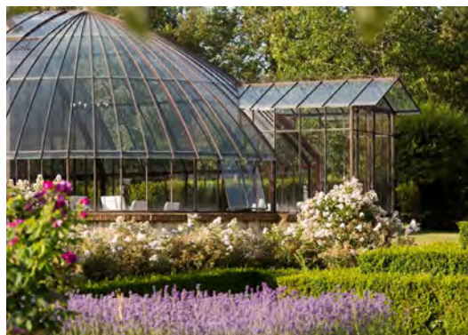
Jardin de la Borde