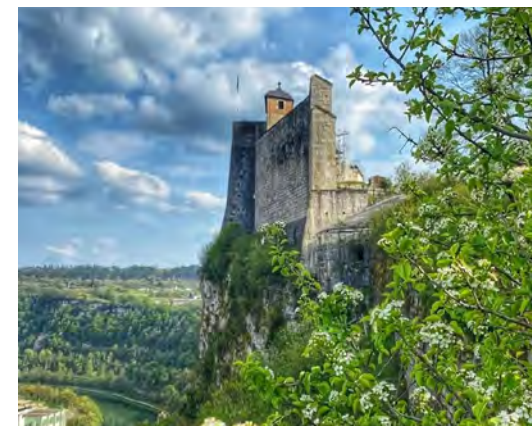
Citadelle de Besançon