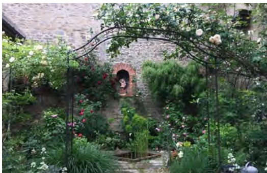
Jardin du « Petit lavoir »

Dimanche 2 juin 2024 : 10h - 12h | 14h - 18h