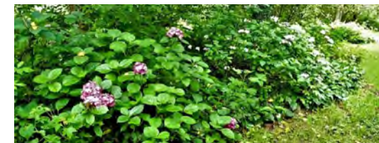
Jardin de Cassandra

Dimanche 2 juin 2024 : 10h - 12h | 14h - 18h