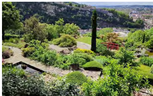
Les Terrasses de Besançon

Dimanche 2 juin 2024 : 09h - 12h | 13h - 17h