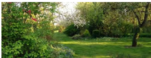
Les Hespérides

Dimanche 2 juin 2024 : 10h - 12h | 14h - 19h