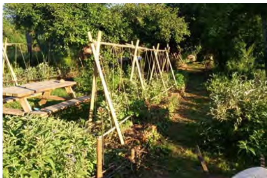
Jardin en permaculture