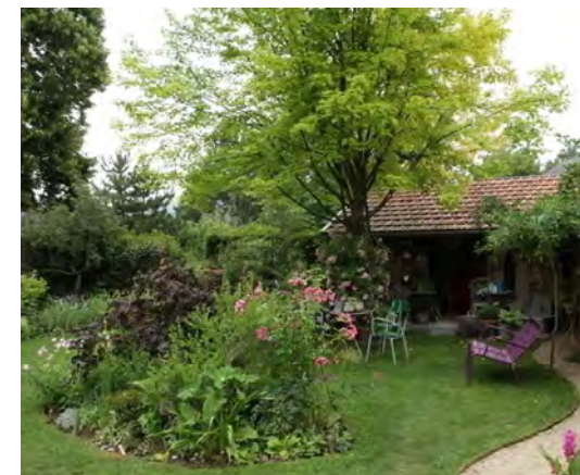
Jardin « un p'tit coin de charme »