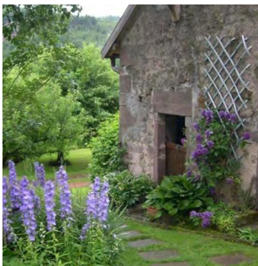
Jardin de la Ferrière