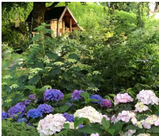
Jardin du clos de « La dame verte »