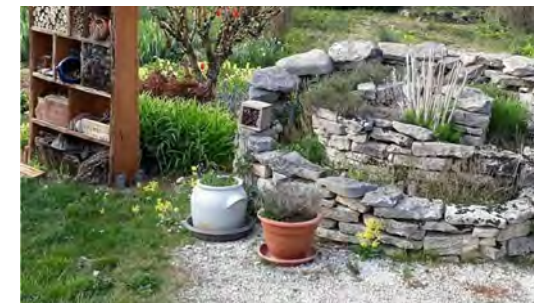
Jardin « À la croisée des sens »

Dimanche 2 juin 2024 : 10h - 12h | 14h - 18h