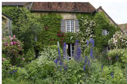
Jardin de la Fontaine