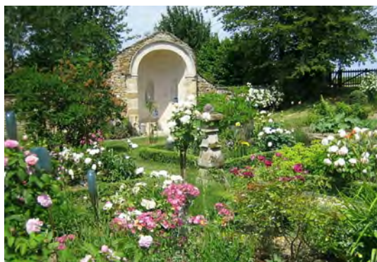
Jardin du presbytère