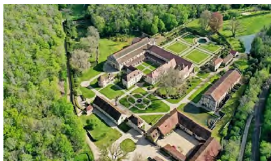
Abbaye de Fontenay

Dimanche 2 juin 2024 : 10h - 12h | 14h - 18h