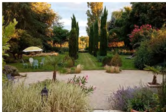
Jardin de la Renaudière