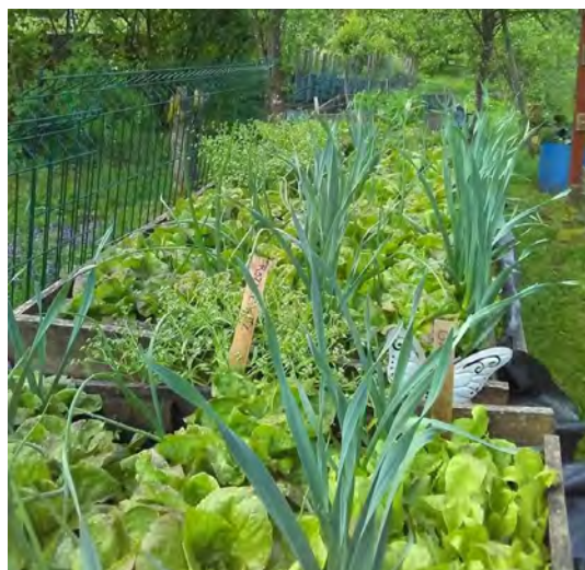
Les jardins de Fraîche-Comté