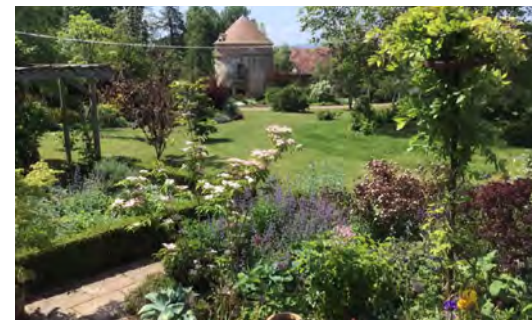
Jardin de l'escargot errant