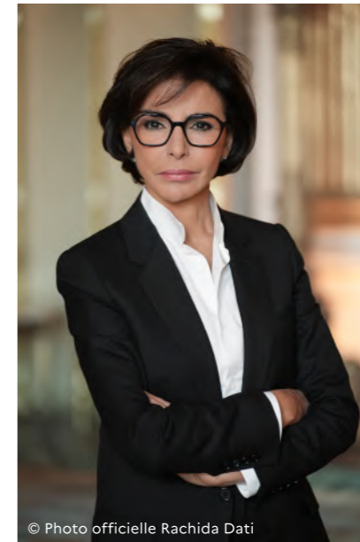
© Photo officielle Rachida Dati

Du 31 mai au 2 juin 2024, la 21 e édition des Rendez-vous aux jardins est une invitation à la promenade et à la découverte (ou la redécouverte !) de nos espaces verts. Jardins publics ou privés, historiques ou contemporains, en France et dans une vingtaine de pays européens, c'est là que pourront se retrouver les passionnés de botanique aussi bien que les flâneurs en quête de quiétude et d'inspiration.