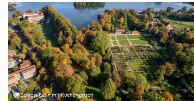
Schloss Eutin mit Küchengarten

Une sculpture représentant Victor Hugo se trouve dans la partie supérieure des jardins. Un petit espace créé par la société de Victor Hugo à Guernesey est planté de végétaux rendant hommage aux personnages romanesques créés par l'auteur.